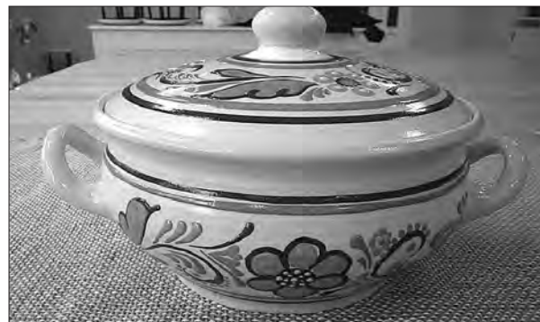
Одна з робіт майстра.