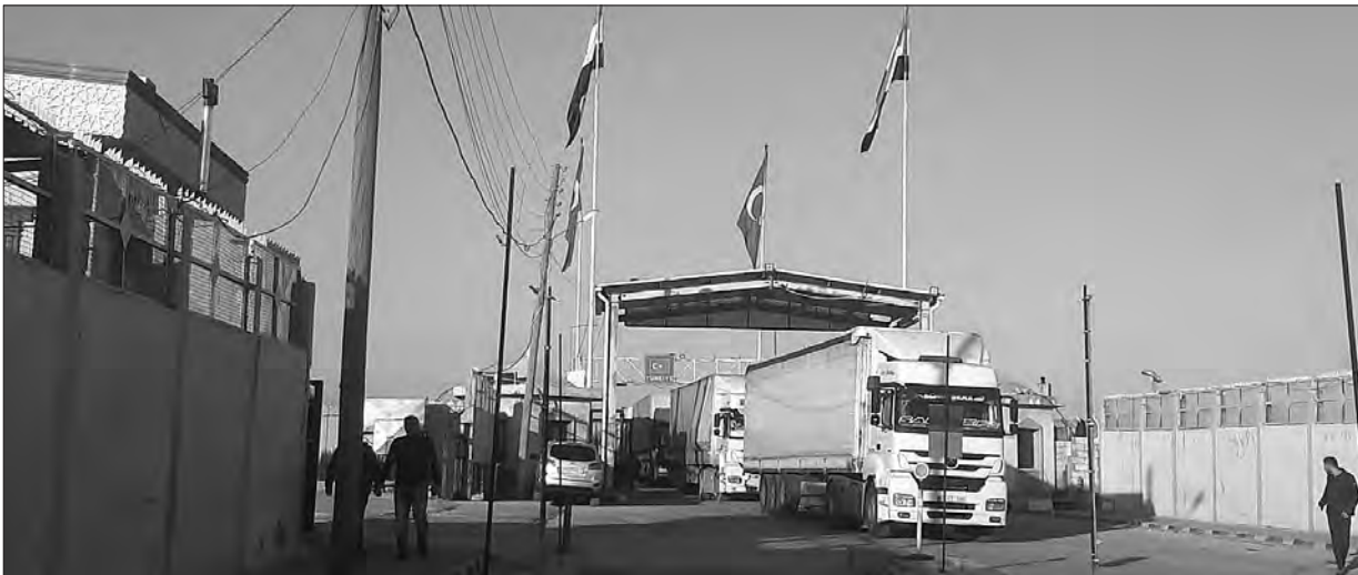
Заступник генсека ООН з гуманітарних питань, координатор надзвичайної допомоги Мартін Гріффітс повідомив, що 37 вантажівок із допомогою від Міжнародної організації з міграції та УВКБ було доправлено до Сирії.

лих щодня зростає, і на цьому тлі неймовірними видаються новини, що навіть через 200 годин після землетрусу з-під завалів продовжують витягувати живих людей.