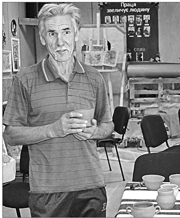
Гончарством майстер займається з дитинства.

Адміністрація Галицинівської громади забезпечила студію, каже